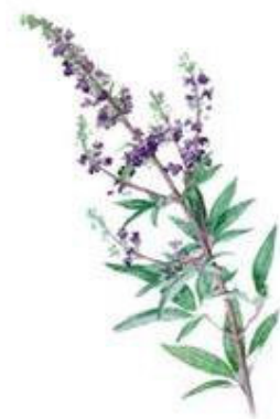
Vitex agnus - castus (Kuisboom)

Zowel acupunctuur als fytotherapie (kruidengeneeskunde) kunnen goede resultaten geven bij PMS klachten. Zoals met alle menstruele problemen, zal het minimum 3 menstruele cycli duren voordat de cyclus volledig gereguleerd zal zijn, alhoewel men vaak al verbetering ziet na de eerste maand.